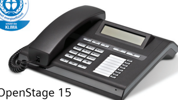
OpenStage 15 Lava