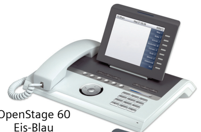
OpenStage 60 Eis-Blau