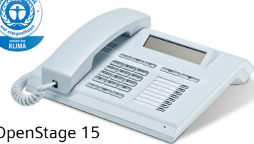
OpenStage 15 Eis-Blau