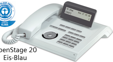
OpenStage 20 Eis-Blau