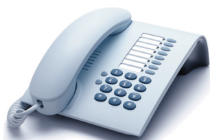
OpenStage 5 Eis-Blau