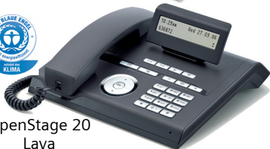
OpenStage 20 Lava