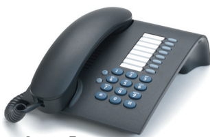
OpenStage 5 Lava