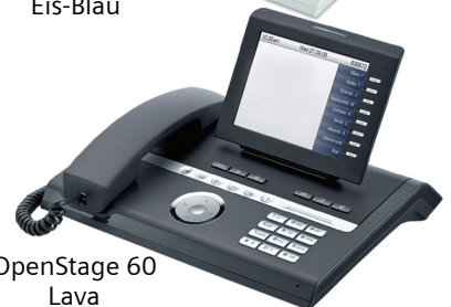
OpenStage 60 Lava