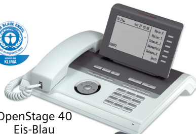
OpenStage 40 Eis-Blau