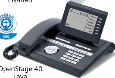
OpenStage 40 Lava